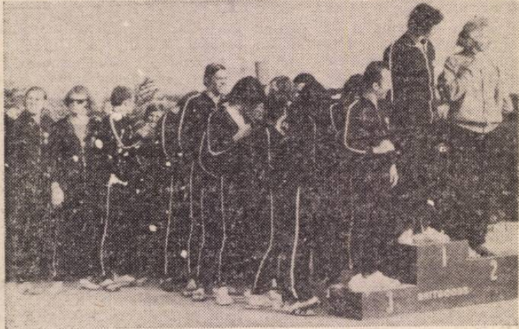
A dobogó legfelső fokán.